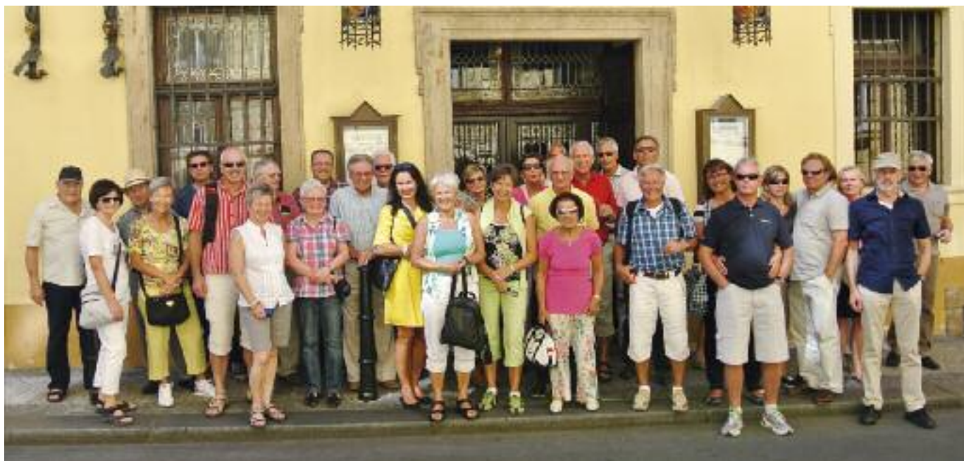
Die Gewerbereise 2012 führte nach Prag