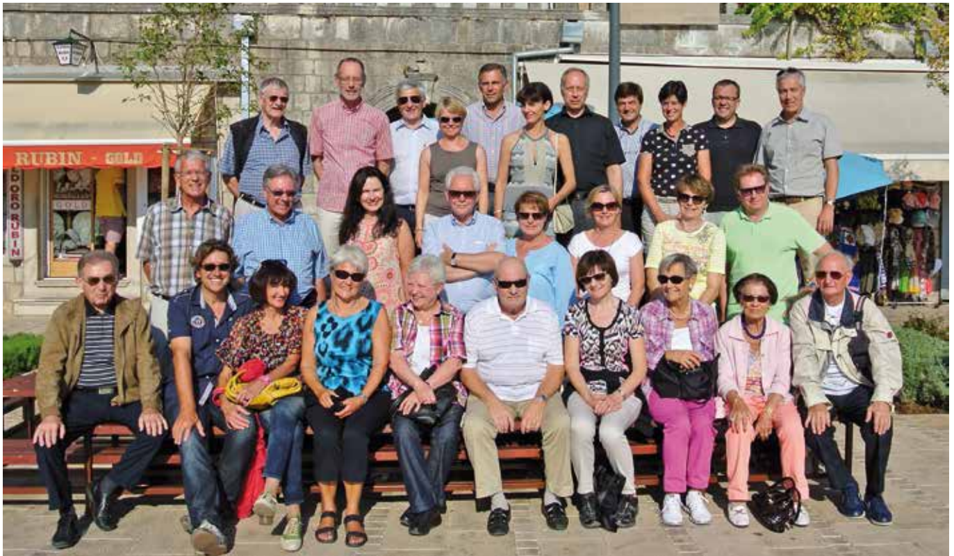
Die Gewerbereise 2013 führte nach Dubrovnik, Kroatien